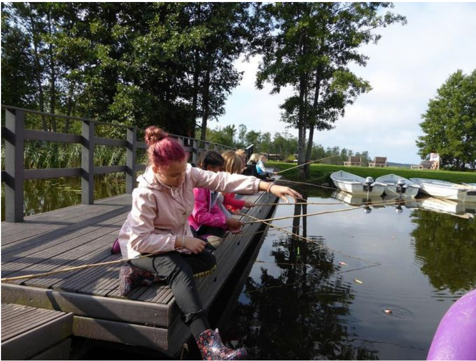
Koonga kooli Ermistu looduskeskuse külastus.