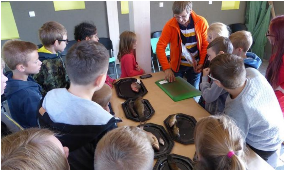
Koonga kooli Ermistu looduskeskuse külastus.